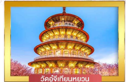
วัดอู่จี้เทียนหยวน