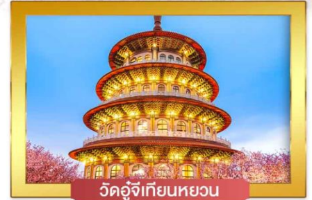
วัดอู่จี้เทียนหยวน