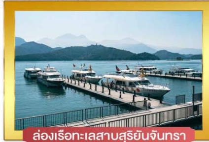
ล่องเรือทะเลสาบสุริยจันทร์