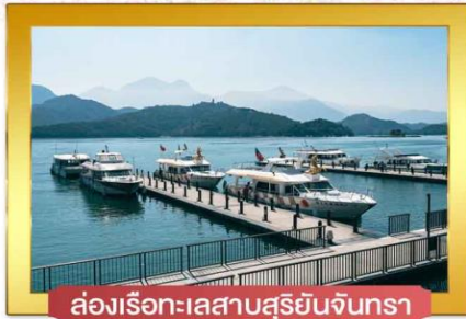
ล่องเรือทะเลสาบสุริยจันทร์