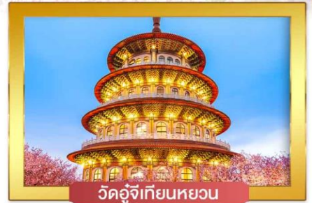
วัดอู่จี้เทียนหยวน