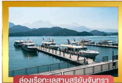
ล่องเรือทะเลสาบสุรียันจินตรา