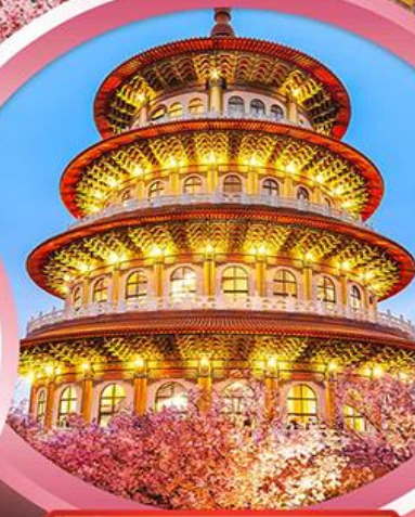
วัดจู้เทียนหยวน

ช้อปปิ้งจุใจ ย่านซีเหมินติง ตลาดไทจงไนท์มาร์เก็ต อัมร่อยกับ..เมนูปลาประดาน้ำคิตี ซาบูบุฟเฟ่ต์สไตล์ไต้หวัน เสียวหลงเปา