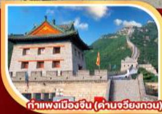
กำแพงเมืองจีน (ด่านจวิ๊ยกทวน)