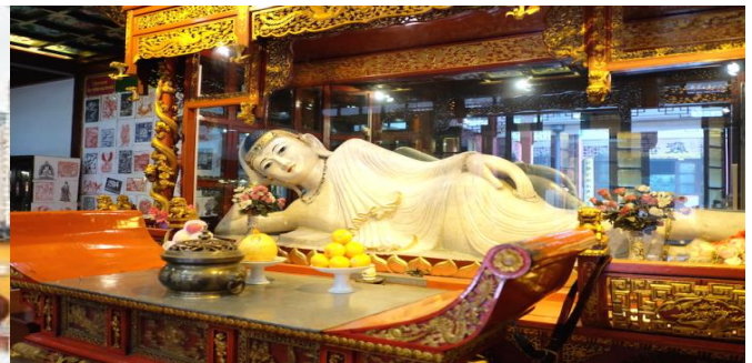
GO1CNXPVG-MU005 บินตรงเชียงใหม่ ทะลุ..เที่ยวมหานครเซี่ยงไฮ้ ชูโจว จูเจียเจียว 6 วัน 5 คืน (MU)