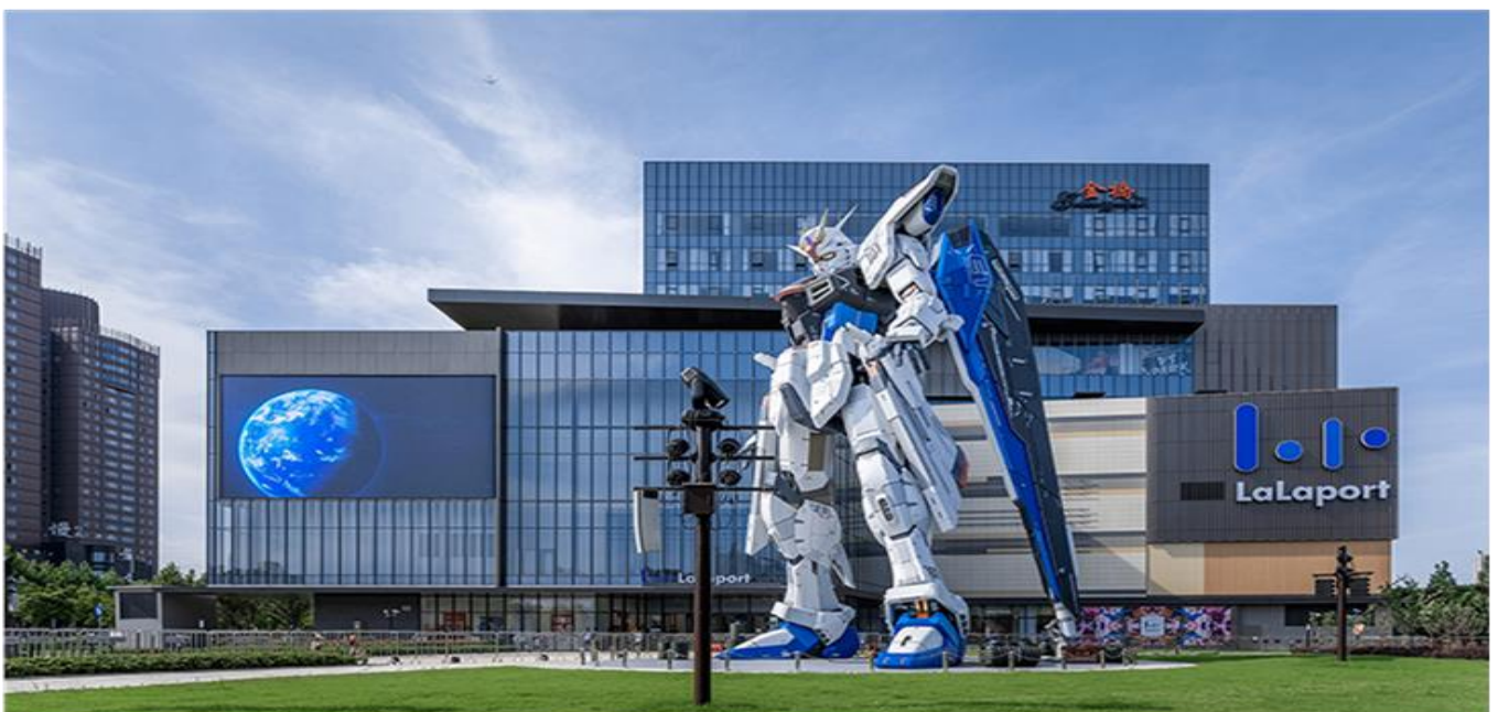
GO1CNXPVG-MU005 บินตรงเชียงใหม่ ตะลุย..เที่ยวมหานครเชียงไฮ้ ชูโจว จูเจียเจียว 6 วัน 5 คืน (MU)

จากนั้นนำท่านเดินทางกลับสู่ Mitsui Shopping Park LaLaport ให้ท่านได้อิสระช้อปปิ้งสินค้าแบรนด์เนมชั้นนำ กว่า 180 ร้าน และให้ท่านได้ถ่ายรูปกับ GUNDAM FREEDOM ขนาด 18.03 เมตร และเป็นGundam ตัวเดียวที่มีขนาดใหญ่ ที่อยู่นอกประเทศญี่ปุ่น