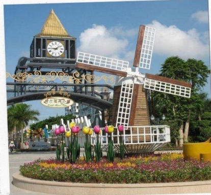
สวนดอกไม้ฮอลแลนด์