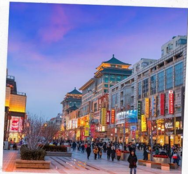
ช้อปปิ้งถนนปักกิ่ง