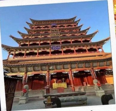
วัดพระใหญ่