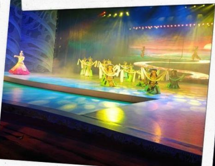
โชว์หมู่บ้านวัฒนธรรม