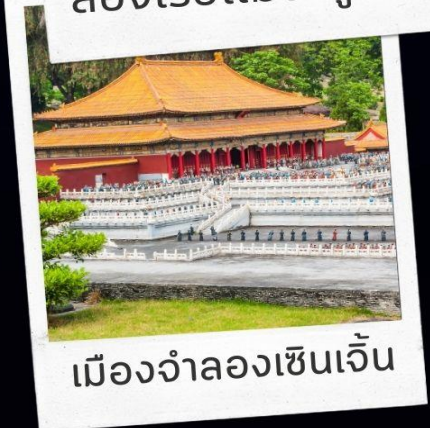
เมืองจำลองเซินเจิ้น