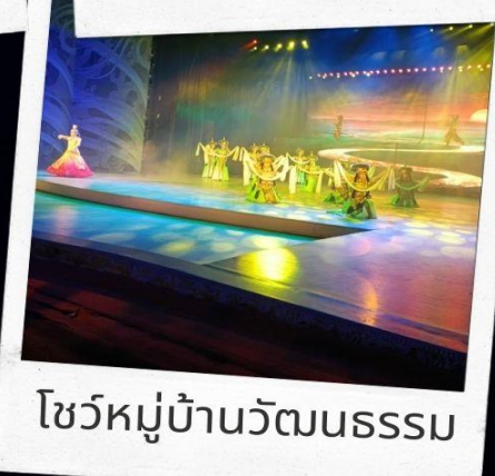
โชว์หมู่บ้านวัฒนธรรม