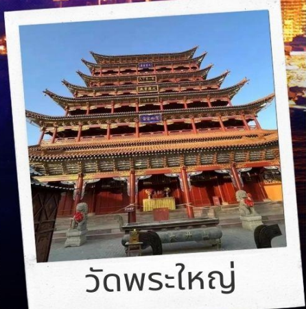
วัดพระใหญ่