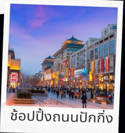
ช้อปปิ้งถนนปักกิ่ง