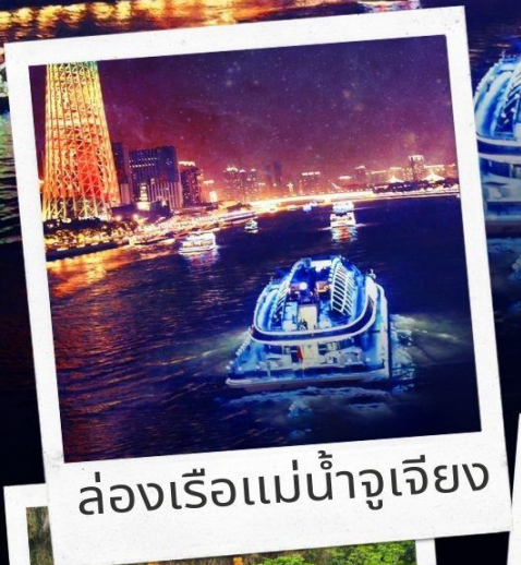
ล่องเรือแม่น้ำจูเจียง