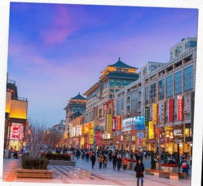
ช้อปปิ้งถนนปักกิ่ง