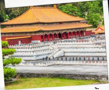
เมืองจำลองเซินเจิ้น