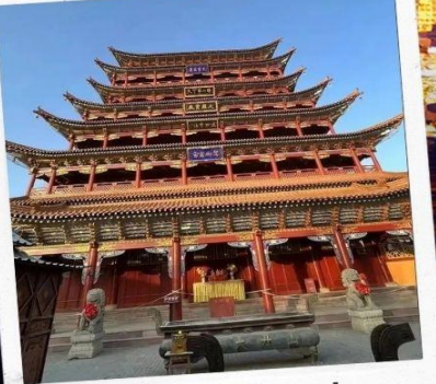
วัดพระใหญ่