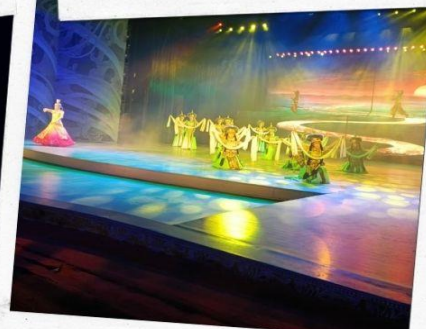
โชว์หมู่บ้านวัฒนธรรม