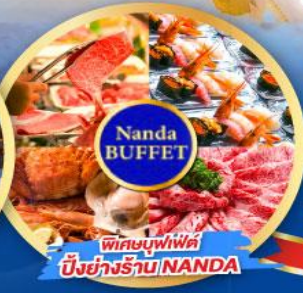
พิเศษบุฟเฟต์ บึงย่างร้าน NANDA

เดินทาง (วันปีใหม่ 2568) 27 ธ.ค.-01 ม.ค. 68 29 ธ.ค.-03 ม.ค. 68