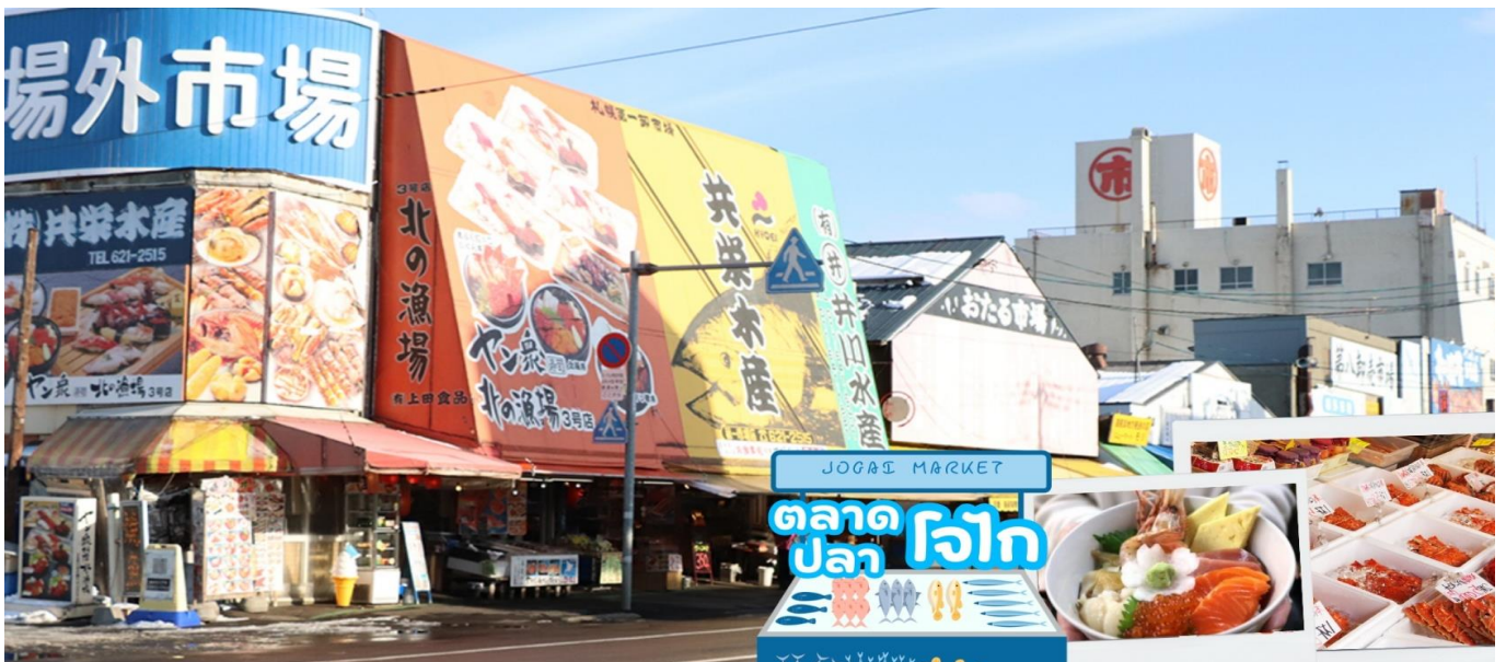
GO2CTS-TG030 -- HOKKAIDO FURANO SNOW NEW YEAR 6D 4N BY TG

พิพิธภัณฑ์เบียร์ซัปโปโร (Sapporo Beer Museum) ด้านในของพิพิธภัณฑ์จะแนะนำประวัติของเบียร์ในญี่ปุ่น และกระบวนการขั้นตอนการผลิตเบียร์ ทั้งความละเอียดของข้อมูลและการจัดแสดง ด้านหลังนิทรรศการมีให้ชิมเบียร์ฟรีอีกด้วยถ้าเดินทางเพลินจนเหนื่อยแล้วอยากหาที่นั่งชิลๆ พร้อมเติมพลังและเบียร์ที่ชิมมันน้อยเกินไป ก็สามารถเดินไปใกล้ๆกับตัวพิพิธภัณฑ์ได้ เนื่องจากเป็นสวนเบียร์ซัปโปโร (Sapporo Beer Garden) ประกอบด้วยร้านอาหาร 2 ร้าน คือ Garden Grill และ Genghis Kan Hall มีบรรยากาศสบายๆกับการดื่มเบียร์ และรับประทานบาร์บีคิวเนื้อแกะ ซึ่งเป็นอาหารท้องถิ่นที่นิยมมากๆ และไม่ยากให้พลาดทีเดียว