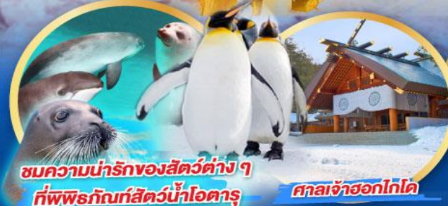
ชมความน่ารักของสัตว์ต่างๆ ที่พิพิธภัณฑ์สัตว์น้ำโฮตารุ