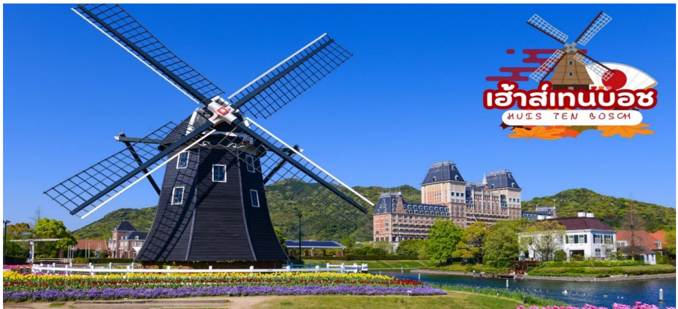
GO2FUK-TG013 – KYUSHU SAGA HUIS TEN BOSCH NEW YEAR 6D 4N BY TG

กลางวัน รับประทานอาหารกลางวัน ณ ร้านอาหาร (มือที่ 1)