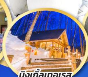
นิงเกิ้ลเทอเรส