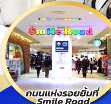
ถนนแห่งรอยยิ้มที่ Smile Road