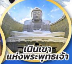
เน็นเงาแห่งพระพุทธรเจ้า

ชมความน่ารักของสัตว์ต่างๆ ที่พิพิธภัณฑ์สัตว์น้ำโอตารุ