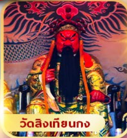
วัดลิ่งเกียนกง