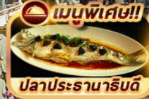
เมนูพิเศษ!! ปลาประจานารินดี