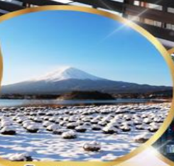
สวน โออิชิ พาร์ค