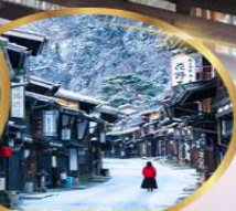
หมู่บ้านโบราณ นารายิ ชุกุ

ราคา เริ่มต้น 39,919 บาท รวมภาษีมูลค่าเพิ่ม 7%