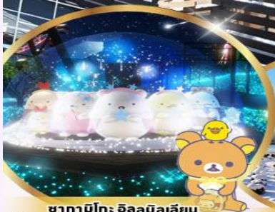
ซากามิโกะ อิลลูมินาเลี่ยน ธรมถาร์ตูดนสุดนารีทจากถ่าย SAN-X