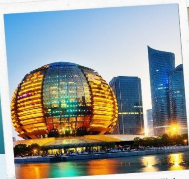
HANGZHOU CITY BALCONY