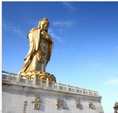
เกาะผู้โถวซาน