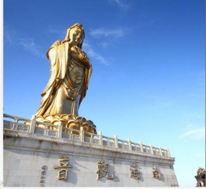
เกาะผู้โถวซาน