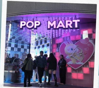
ถนนนานกิง