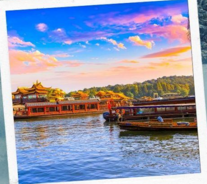
ทะเลสาบซีหู