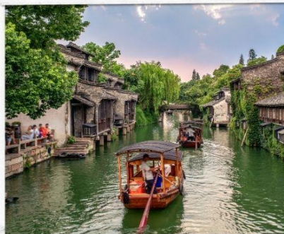
เมืองโบราณอูเจิ้น