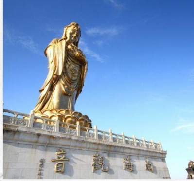
เกาะผู้โถวซาน