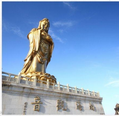
เกาะผู้ไถวซาน