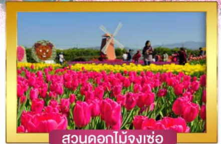
สวนดอกไม้จงเซอ