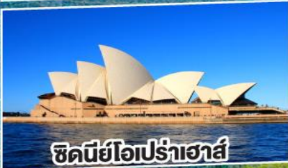
ซิดนีย์โอเปร่าเฮาส์