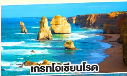
เกรทโอเซียนโรด