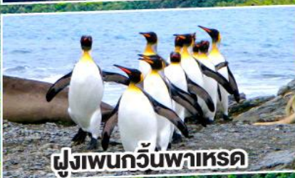
ฝูงเพนกวินพาเหรด