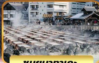
ชมยุบาทาเกะ