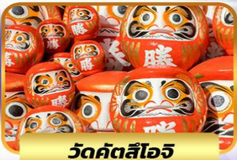
วัดคัตสึโงจิ