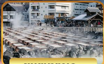
ชมยูบาทาเกะ