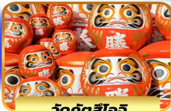
วัดคัตสึโงจิ