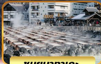
ชมยุบารากะ