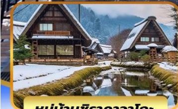
หมู่บ้านชิราคาวาโกะ

ไอซาก้า คุสัทซึ คาวาโกเอะ ทากายามา โตเกียว