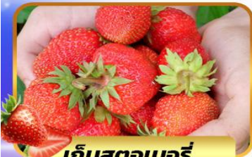
เก็บสตอเบอร์รี่