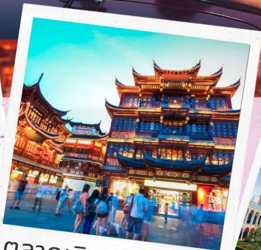
ตลาดเจิ้งหวังเมี่ยว