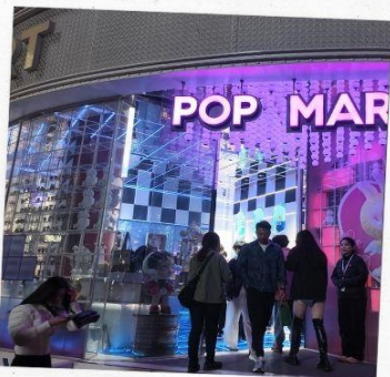
ถนนนานกิง