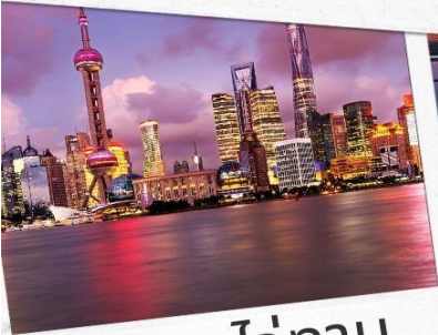
หาดไว่ทาน