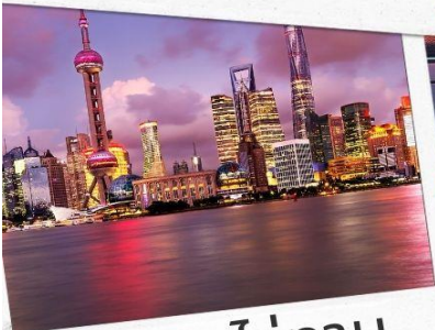
หาดไว่ทาน