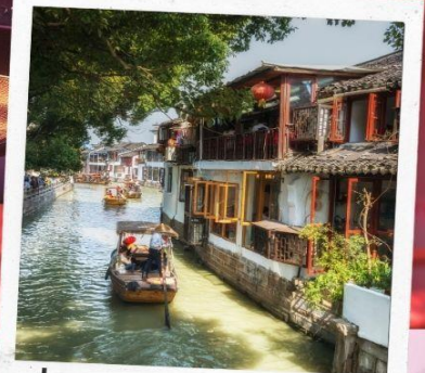
ล่องเรือจูเจียเจี้ยว