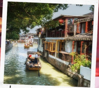
ล่องเรือจูเจียเจี้ยว