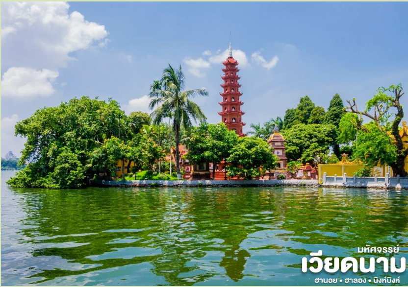
มหัศจรรย์ เวียดนาม ฮานอย • ฮาลอง • ینگบิงห์

📍 นำท่าน เดินทางสู่ วัดเงินก๊วก เป็นวัดที่อยู่ใจกลางเมืองของเวียดนาม ใกล้ชิดกับทะเลสาบตะวันตกของเมืองฮานอย ภายในวัดมี เจดีย์เงินก๊วก (Chua Tran Quoc) เป็นเจดีย์ที่สำคัญและเก่าแก่ของชาวเวียดนาม การสร้างเจดีย์แห่งนี้ ใช้ศิลปะที่มีการผสมผสานกันอย่างลงตัว ระหว่างสถาปัตยกรรมจีนและเวียดนาม มีความสูง 15 เมตร มีทั้งหมด 11 ชั้น ภายในมีจารึกประวัติความเป็นมาทั้งของเจดีย์และพระศรีศากยมุนีปางปรินิพพานที่ทำด้วยทองคำ