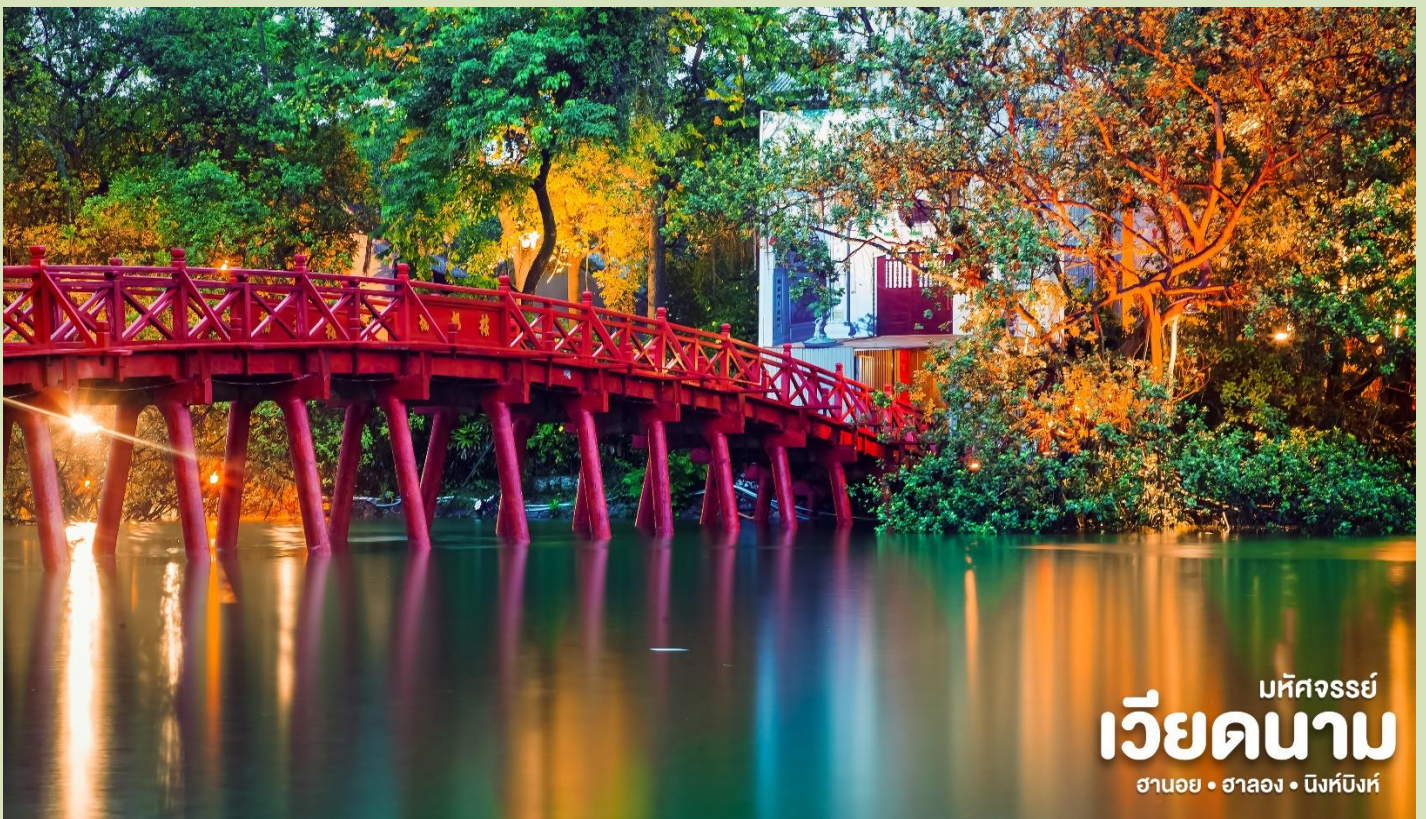
มหิตจรรย์ เวียดนาม ฮานอย • ฮาลอง • นิงห์บิงห์

📍 จากนั้น นำท่านข้าม สะพานแสงอาทิตย์ สีแดงสดใสสู่กลางทะเลสาบคืนดาบ ชม วัดห่งเกิน วัดโบราณ ภายในประกอบด้วย ศาลเจ้าโบราณ และ เต่าสตัฟ ขนาดใหญ่ ซึ่งมีความเชื่อว่า เต่าตัวนี้ คือเต่าศักดิ์สิทธิ์ 1 ใน 2 ตัวที่อาศัยอยู่ในทะเลสาบแห่งนี้มาเป็นเวลาช้านาน นำท่าน อิสระช้อปปิ้งถนน 36 สาย มีสินค้าราคาถูกให้ท่านได้เลือกสรรมากมาย กระเป๋า เสื้อผ้า รองเท้า ของที่ระลึกต่างๆ ฯลฯ