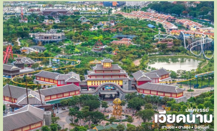
บึงคังสร้อย เวียดนาม ฮานอย • ฮาลอง • ฮึงห์บิงห์

📍 นำท่าน นั่งกระเช้าที่ใหญ่ที่สุดในโลก ( Queen Cable Car ) เป็นกระเช้าลอยฟ้า 2 ชั้นที่ใหญ่ที่สุดในโลกซึ่งจะนั่งกระเช้าข้ามทะเลไปตามระยะทาง 2,165 เมตร ทำให้เห็นวิวทิวทัศน์ที่สวยงามของเมืองฮาลองในมุมสูง เพื่อเดินทางไปยังสวนสนุก ( Sun World Halong Complex ) เป็นสวนสนุกที่รวมความบันเทิงอันทันสมัยบนภูเขา Ba Deo มีเครื่องเล่นมากมาย ภายในสวนสนุกยังมีสวนญี่ปุ่น พิพิธภัณฑ์หุ่นขี้ผึ้ง โรงละครหุ่นกระบอก โดยมีแลนด์มาร์คของสวนสนุก คือ ซิงข้าววงสีแดง Sun Wheel เป็นชิงช้าที่มีขนาดใหญ่และสามารถชมวิวฮาลองเบย์แบบมุมสูงได้ 360 องศา และนำท่านแวะชม ร้านหยก เพื่อเลือกซื้อเป็นของที่ระลึก