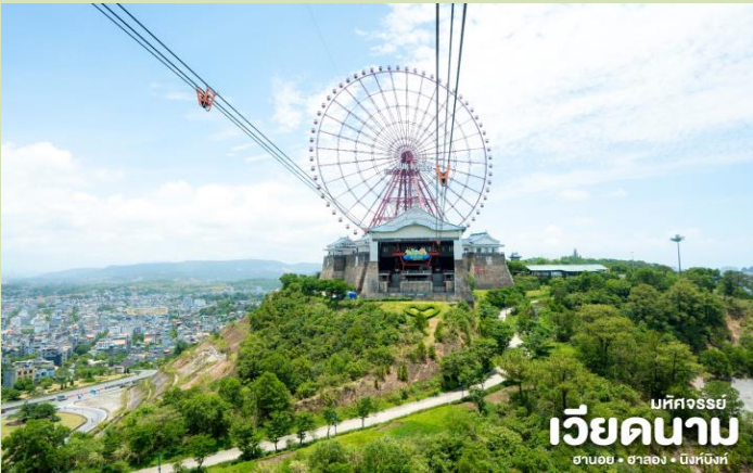
บึงคังสร้อย เวียดนาม ฮานอย • ฮาลอง • ฮึงห์บิงห์