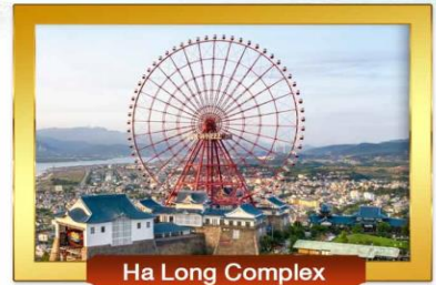
Ha Long Complex