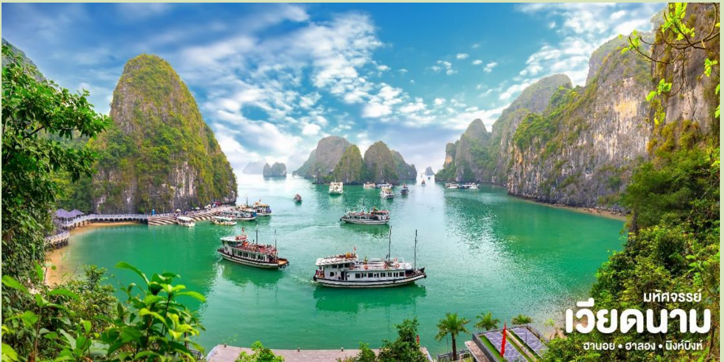
มทิจจรีย์ เวียดนาม ฮานอย • ฮาลอง • นิงห์บิ่งห์

นำท่าน ออกเดินทางสู่ท่าเรือเพื่อล่องเรือชมความงามตามธรรมชาติที่สรรค์สร้างด้วยความงดงามดั่งภาพวาด โดยจิตรกรเอก อ่าวฮาลอง ประกอบด้วยหมู่เกาะน้อยใหญ่กว่า 1,900 เกาะได้รับการประกาศเป็นมรดกโลกโดยองค์การยูเนสโกอ่าวแห่งนี้เต็มไปด้วยภูเขาหินปูนมากมายระหว่างการล่องเรือท่านจะได้ชมความงามของเกาะต่างๆทั้งเกาะหมา เกาะแมวเกาะไก่ชน ฯลฯ