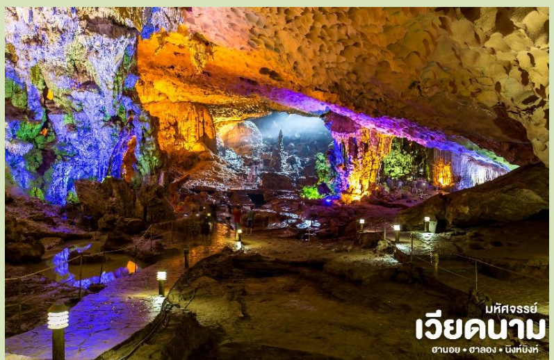
มทิจจรีย์ เวียดนาม ฮานอย • ฮาลอง • นิงห์บิ่งห์

นำท่าน ชม ถ้ำสวรรค์ ชมหินงอกหินย้อยมากมายล้วนแต่สวยงามและน่าประทับใจยิ่งนัก ถ้ำแห่งนี้เพิ่งถูกค้นพบเมื่อไม่นานมานี้ได้มีการประดับแสงสีตามผนังและมุมต่างๆในถ้ำซึ่งบรรยากาศภายในถ้ำท่านจะชมความสวยงามตามธรรมชาติที่เสริมเติมแต่งโดยมนุษย์ นำท่านชมเกาะไก่จุกกัน ซึ่งถือว่าเป็นสัญลักษณ์ของอ่าวฮาลองลักษณะจะเป็นเกาะเล็กๆ 2 เกาะหันหน้าเข้าหากันคล้ายๆกับไก่หรือนกแล้วแต่จินตนาการของแต่ละท่าน