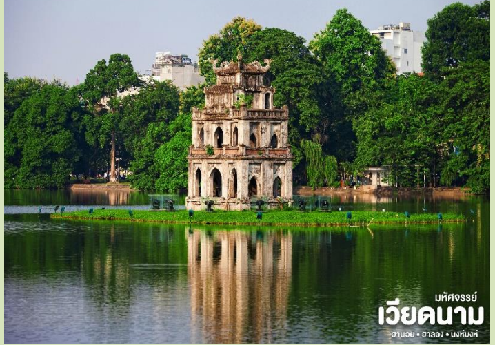
มัทศจรรย์ เวียดนาม ฮานอย • ฮาลอง • นิงห์บิ่งห์

เมืองฮานอย ทะเลสาบแห่งนี้มีตำนานกล่าวว่า ในสมัยที่เวียดนามทำสงครามสู้รบกับประเทศจีน แต่ยังไม่สามารถเอาชนะทหารจากจีนได้สักที ทำให้เกิดความท้อแท้พระทัย เมื่อได้มาล่องเรือที่ทะเลสาบแห่งนี้ ได้มีเต่าขนาดใหญ่ตัวหนึ่งได้คาบดาบวิเศษมาให้พระองค์ เพื่อทำสงครามกับประเทศจีนหลังจากที่พระองค์ได้รับดาบมานั้น พระองค์ได้กลับไปทำสงครามอีกครั้ง และได้รับชัยชนะเหนือประเทศจีน ทำให้บ้านเมืองสงบสุข เมื่อเสร็จศึกสงครามแล้ว พระองค์ได้นำดาบมาคืน ณ ทะเลสาบแห่งนี้