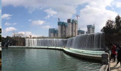
สวนน้ำตก Kunming Waterfall Park