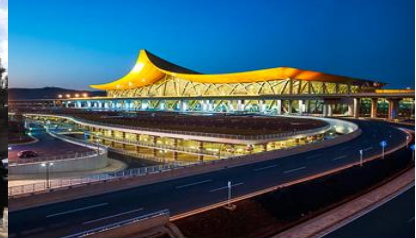
สนามบินเมืองคุนหมิง