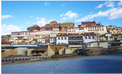
วัดลามะซัวหลิง