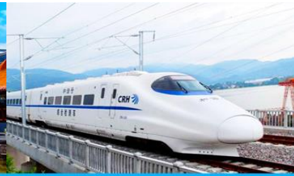
บั้งรถไฟความเร็วสูง