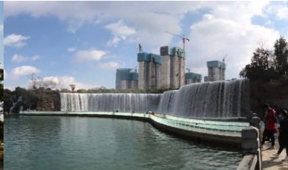
สวนน้ำตก Kunming Waterfall Park