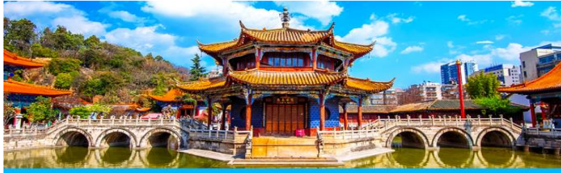
วัดหยวงกง