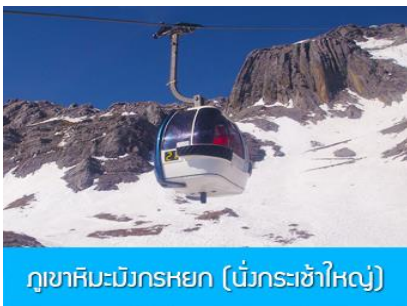
ภูเขาหิมะมังกรหยก (นั่งกระเช้าใหญ่)

ที่พัก FENG HUANG HOTEL ระดับ 4 ดาว หรือเทียบเท่าเมืองลี่เจียง