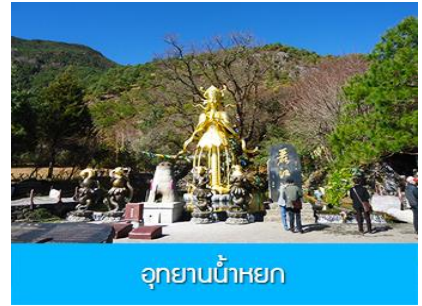
อุทยานน้ำหยก

วันที่สี่ ภูเขาหิมะมังกรหยก (รวมนั่งกระเช้าใหญ่ขึ้นลง)- หุบเขาพระจันทร์สีน้ำเงิน-น้ำตกป๋ายู่เหย่ ออฟชั่น ไกด์ชายรถกอล์ฟ ท่านละ 80 หยวน โชว์ IMPRESSION LIJIANG- อุทยานน้ำหยก -ต้าหลี่