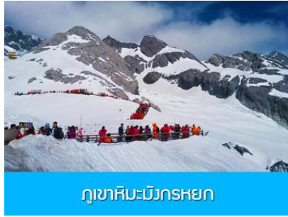
ภูเขาหิมะมังกรหยก