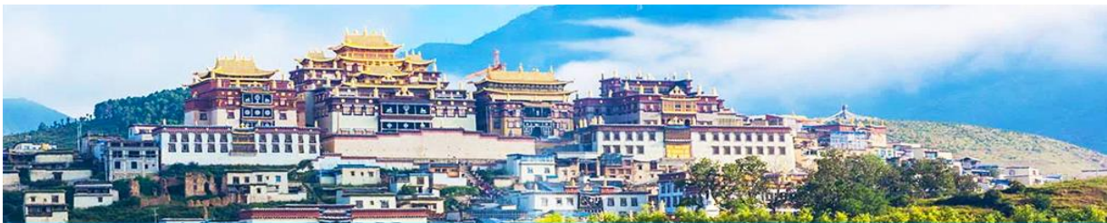
เมืองโบราณแซงกริล่า

จากนั้นนำท่านชม หมู่บ้านซีโจวหรือหมู่บ้านชาวไป๋ ชนพื้นเมืองที่สำคัญของเมือง ชมการแสดงของชนชาติปายพร้อมชิมชาสามแก้ว เพื่อรำลึกถึงวิถีชีวิตและการเกิดมาเป็นมนุษย์ของตนเอง ซึ่งถือเป็นเอกลักษณ์ของชนชาวไป๋ ที่หาดูได้ยาก