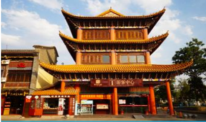
เมืองโบราณกวนตุ๋

พักที่ FEI LONG HOTEL ระดับ 4 ดาว หรือเทียบเท่าในเมืองต้าหลี่