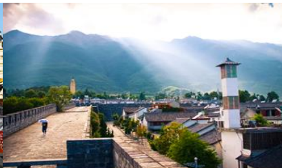
หมู่บ้านฮิวโจว(หมู่บ้านชาป๋อ)