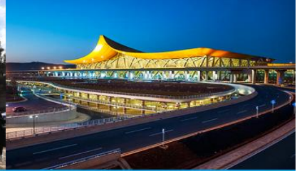
สนามบินเมืองคุนหมิง