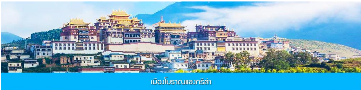
เมืองโบราณแซงกริล่า

จากนั้นนำท่านชม หมู่บ้านซีโจวหรือหมู่บ้านชาวไป๋ ชนพื้นเมืองที่สำคัญของเมือง ชมการแสดงของชนชาติปายพร้อมชิมชาสามแก้ว เพื่อรำลึกถึงวิถีชีวิตและการเกิดมาเป็นมนุษย์ของตนเอง ซึ่งถือเป็นเอกลักษณ์ของชนชาวไป๋ ที่หาดูได้ยาก