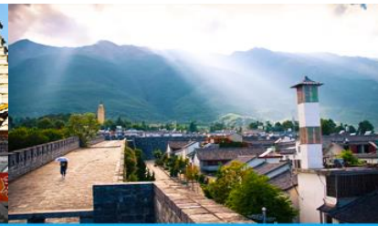
หมู่บ้านฮิว(หมู่บ้านชาวป๋าย)