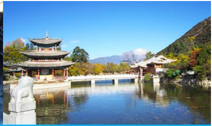
สระน้ำมังกรดำ