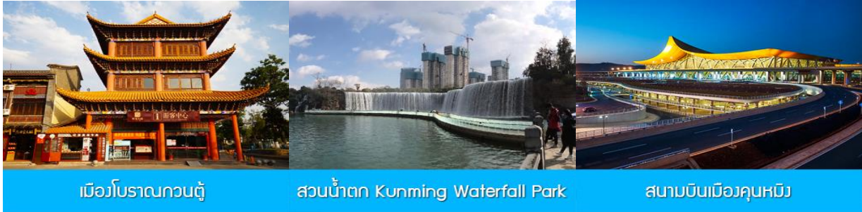
เมืองโบราณกวนตุ๋

พักที่ FEI LONG HOTEL ระดับ 4 ดาว หรือเทียบเท่าในเมืองต้าหลี่