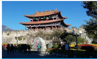
เมืองโบราณต้าลี่

18.26 น. เดินทางถึงเมืองต้าลี่ นำท่านสู่ภัตตาคารในเมืองต้าลี่ ค่ำ รับประทานอาหารค่ำ ณ ภัตตาคาร หลังอาหารนำท่านเข้าสู่ที่พัก พักที่ DALI ZHUANG HOTEL ระดับ 4 ดาวหรือเทียบเท่าในเมืองต้าลี่