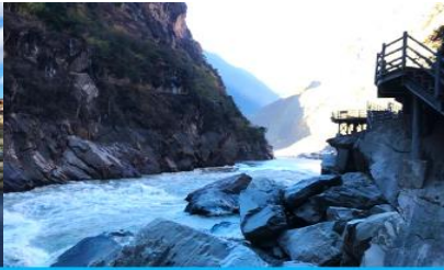
ช่องแคบเสื่อกระโจน