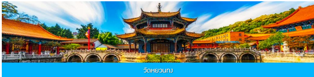
วัดหยวนทง

พักที่ VIENNA HOTEL ระดับ 4 ดาว หรือเทียบเท่าในเมืองคุนหมิง