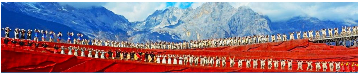
การแสดง IMPRESSION LIJIANG

หลังอาหารนำท่านชมการแสดง IMPRESSION LIJIANG โชว์อันยิ่งใหญ่โดยผู้กำกับชื่อก้องโลก “จาง อวิ๋หมว” ได้เนรมิต ให้ภูเขาหิมะมังกรหยกเป็นฉากหลัง และบริเวณทุ่งหญ้าเป็นเวทีการแสดง โดยใช้นักแสดงกว่า 600 ชีวิต แสง สี เสียง การแต่งกายตระการตา เล่าเรื่องราวชีวิตความเป็นอยู่ และชาวเผ่าต่างๆ ของเมืองลี่เจียง