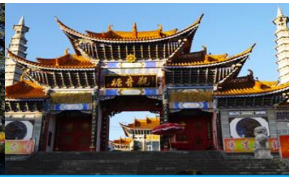
วัดเจ้าแม่กวนอิมแปลงกาย