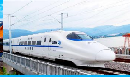
บั้งรถไฟความเร็วสูง