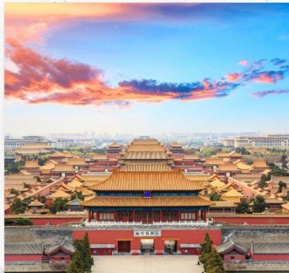
พระราชวังกู้กง