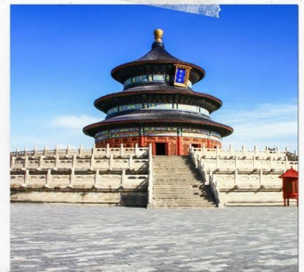
หอบูชาเทียนถาน