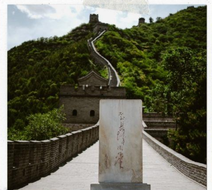
กำแพงเมืองจีน ด่านวิหยงกวน