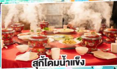
สุกี้ไคมน้ำแข็ง