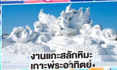
งานแกะสลักหิมะ เกาะพระเจ้ากิตย