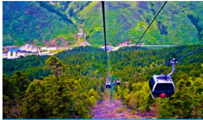
นั่งกระเช้าขึ้นสู่อุทยานหวงหลง