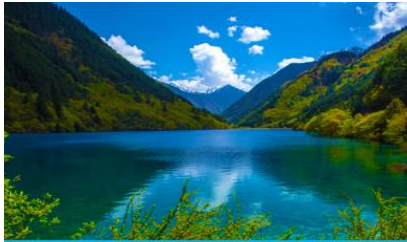
ทะเลสาบแรด (RHINO LAKE)