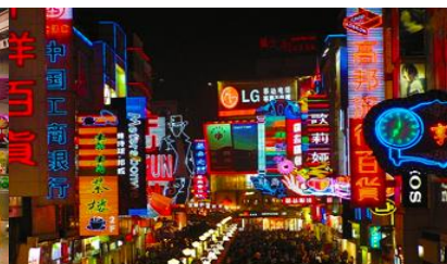
ถนนคนเดินซุนซู่