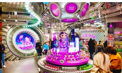
ร้าน POP MART