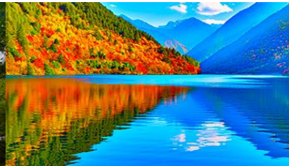
ทะเลสาบแพนด้า

วันที่สาม อุทยานจิวจ้ายโกว (รถเมย์ในอุทยาน)-ทะเลสาบแรด-น้ำตกธารไข่มุก-ทะเลสาบนกยูง-ทะเลสาบแพนด้า