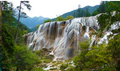
น้ำตกธารไข่มุก