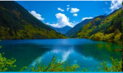
ทะเลสาบแรด (RHINO LAKE)