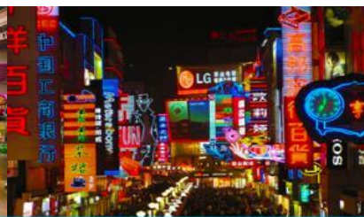
ถนนคนเดินซุนซู่