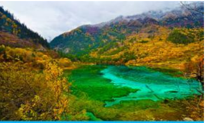
ทะเลสาบนกยูง (PEACOCK LAKE)

นำท่านชม ทะเลสาบแรด (RHINO LAKE) สูงจากระดับน้ำทะเล 2,301 เมตร น้ำลึกโดยเฉลี่ย 17 เมตร ขาวราว 2 กิโลเมตร เป็นทะเลสาบขนาดใหญ่ เส้นน้ำรอบๆ กระทบใจของทะเลสาบนี้คือ หมู่มะพร้าวและสายหมอกที่สะท้อน ทะเลสาบแรดจนแยกไม่ออกว่าส่วนไหนที่เป็นท้องฟ้า ความเปลี่ยนแปลงของทั้งหมอกและหมอกในทิวเขา ให้ความงดงามที่แตกต่างกันไปในแต่ละวันอย่างน่าประทับใจ นอกจากนี้ทะเลสาบแรดเป็นทะเลสาบเดียวที่อนุญาตให้นักท่องเที่ยวล่องเรือชมได้ด้วย