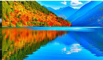
ทะเลสาบแพนต้า

วันที่สาม อุทยานจิวจ้ายโกว (รถเมย์ในอุทยาน)-ทะเลสาบแรด-น้ำตกธารไข่มุก-ทะเลสาบนกยูง-ทะเลสาบแพนต้า