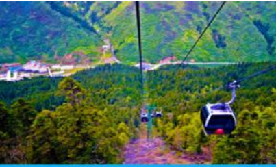
นั่งกระเช้าขึ้นสู่อุทยานหวงหลง