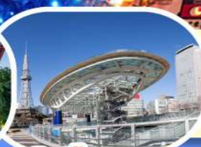
ช้อปปิ้งซากาเอะ