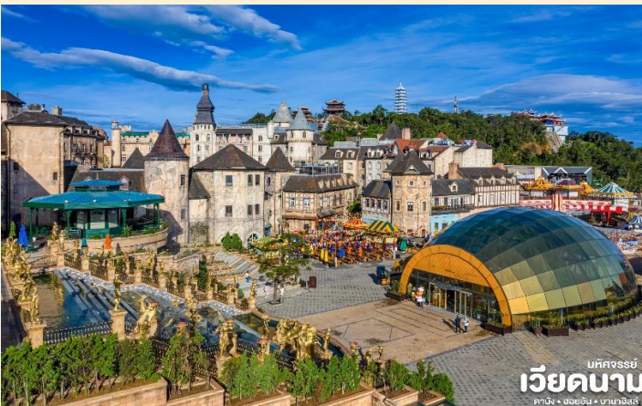
เบคองรัมย์ เวียดนาบ คามิง • ออฮอน • บานาฮิลล์

พักผ่อนในระหว่างการเดินทางที่นั่งกระเช้าด้วยความเสียวพร้อมความสวยงามเราจะได้เห็นวิวธรรมชาติทั้งน้ำตก Toc Tien และลำธาร Suoi no (ในฝัน) นั่งกระเช้าขึ้นสู่บานาฮิลล์ กระเช้าแห่งบานาฮิลล์นี้ได้รับการบันทึกสถิติโลกโดย World Record ว่าเป็นกระเช้าไฟฟ้าที่ยาวที่สุดประเภท Non Stop โดยไม่หยุดแะมีความยาวทั้งสิ้น 5,042 เมตร และเป็นกระเช้าที่สูงที่สุดที่ 1,294 เมตร นักท่องเที่ยวจะได้สัมผัสปุยมะหมอกและบางจุดมีเมฆลอยต่ำกว่ากระเช้าพร้อมอากาศบริสุทธิ์อันสดชื่นจนทำให้ท่านอาจลืมไปเสียด้วยซ้ำว่าที่นี่ไม่ใช่ยุโรป เพราะอากาศที่หนาวเย็นเฉลี่ยตลอดทั้งปี ประมาณ 10 องศาเท่านั้น จุดที่สูงที่สุดของบานาฮิลล์มีความสูง 1,467 เมตรกับสภาพผืนป่าที่อุดมสมบูรณ์ นำท่านชม สะพานสีทอง สถานที่ท่องเที่ยวใหม่ล่าสุดตั้งโดดเด่นเป็นเอกลักษณ์อย่างสวยงาม บนเขาบานาฮิลล์