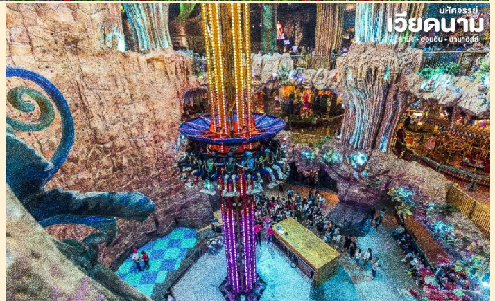
เบคองรัมย์ เวียดนาบ คามิง • ออฮอน • บานาฮิลล์

จุดที่สร้างความตื่นเต้นให้นักท่องเที่ยว มองดูอย่างอลังการที่ซึ่งเต็มไปด้วยเสน่ห์แห่งตำนานและจินตนาการของการผจญภัยที่ สวนสนุก The Fantasy Park (รวมค่าเครื่องเล่นบนสวนสนุก ยกเว้น หุ่นซีผึ้ง โรงบ่มไวน์ และ รถไฟเหาะ Alpine Coaster ที่ไม่รวมให้ในรายการ) ที่เป็นส่วนหนึ่งของบานาฮิลล์