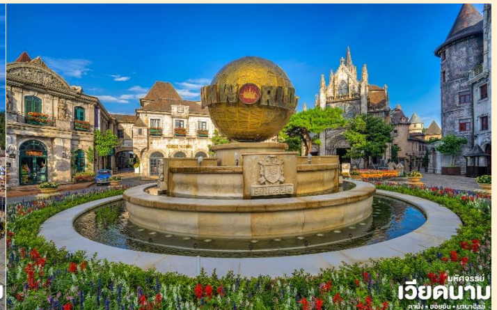
เบคองรัมย์ เวียดนาบ คามิง • ออฮอน • บานาฮิลล์

จุดที่สร้างความตื่นเต้นให้นักท่องเที่ยว มองดูอย่างอลังการที่ซึ่งเต็มไปด้วยเสน่ห์แห่งตำนานและจินตนาการของการผจญภัยที่ สวนสนุก The Fantasy Park (รวมค่าเครื่องเล่นบนสวนสนุก ยกเว้น หุ่นซีผึ้ง โรงบ่มไวน์ และ รถไฟเหาะ Alpine Coaster ที่ไม่รวมให้ในรายการ) ที่เป็นส่วนหนึ่งของบานาฮิลล์