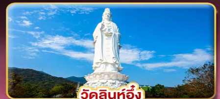
วัดลินห์อึ้ง