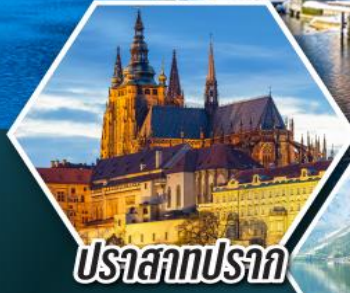
ปราสาทปราก