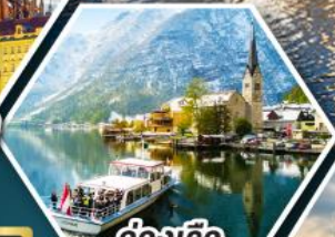
ล่องเรือ ทะเลสาบอัลสติก