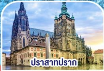
ปราสาทปราก