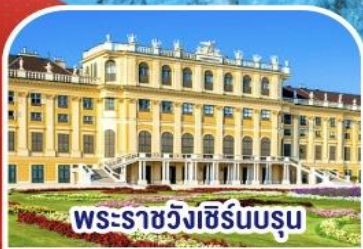
พระราชวังซิรินบรุน