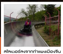
สไลเดอร์จากกำแพงเมืองจีน