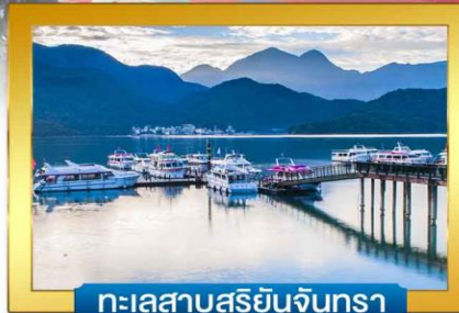
ทะเลสาบสุริยันจันทรา