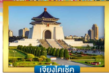
เจียงไคเช็ค