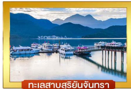
ทะเลสาบสุริยอันจันทรา