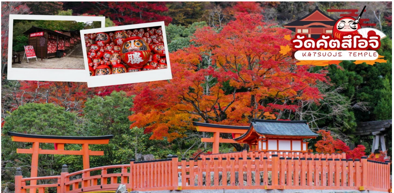
GO2KIX-XJ005 – OSAKA KYOTO AUTUMN & WINTER 5D 3N BY XJ

เมืองโอซาก้า (Osaka) เมืองใหญ่อันดับ 2 ของญี่ปุ่น ตั้งอยู่ในภูมิภาคคันไซ (Kansai) เป็นเมืองยอดนิยมของนักท่องเที่ยวไทยเนื่องจากอาหารอร่อย ผู้คนมีนิสัยคล้ายคนไทย มีสถานที่ท่องเที่ยวครบทุกรูปแบบ และยังเป็นจุดเชื่อมต่อในการเดินทางไปยังจังหวัดอื่นใกล้เคียงได้อย่างสะดวกและรวดเร็วอีกด้วย