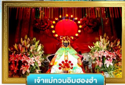
เจ้าแม่กวนอิมสองอำ