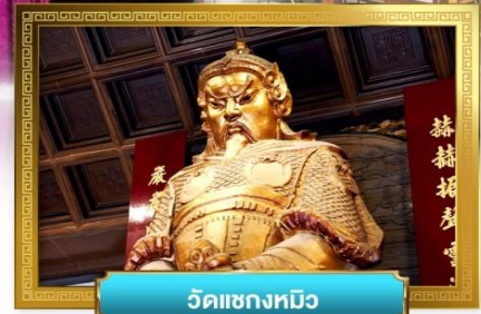
วัดเข่งทมิฬ