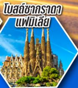
โบสถ์ซากราดาแฟมิลีย