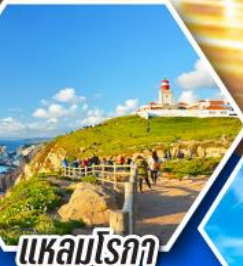
แหลมโรคา