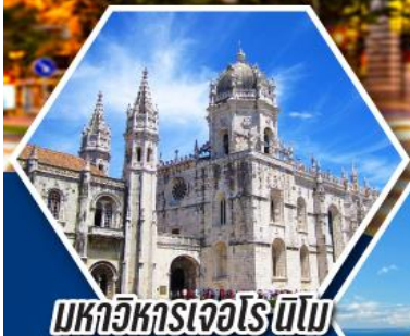
มหาวิหารเจอโรนีโม