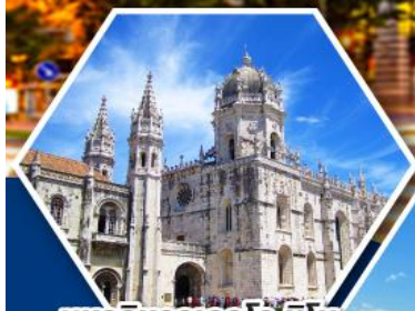
มหาวิหารเจอรอนิโม