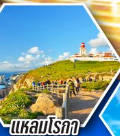
แหลมโรคา