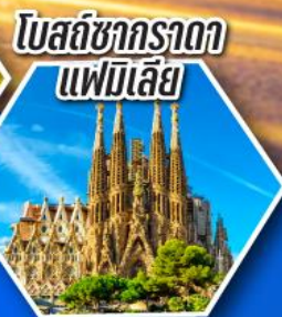
โบสถ์ซากราดาแฟมิลีย