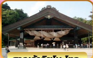
ศาลเจ้าอิซุโมะโทอะ