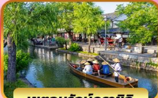
เขตนุรุกิคุชิ