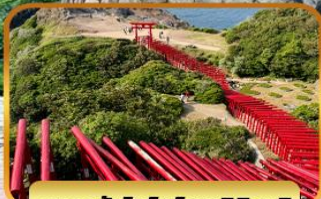
ศาลเจ้าโมโตโนสุมิอินาริ