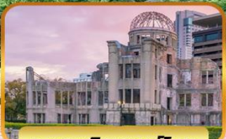
อะตอมบิคบอมบิโดม