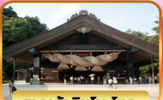
ศาลเจ้าอิซุโมะโทคะ